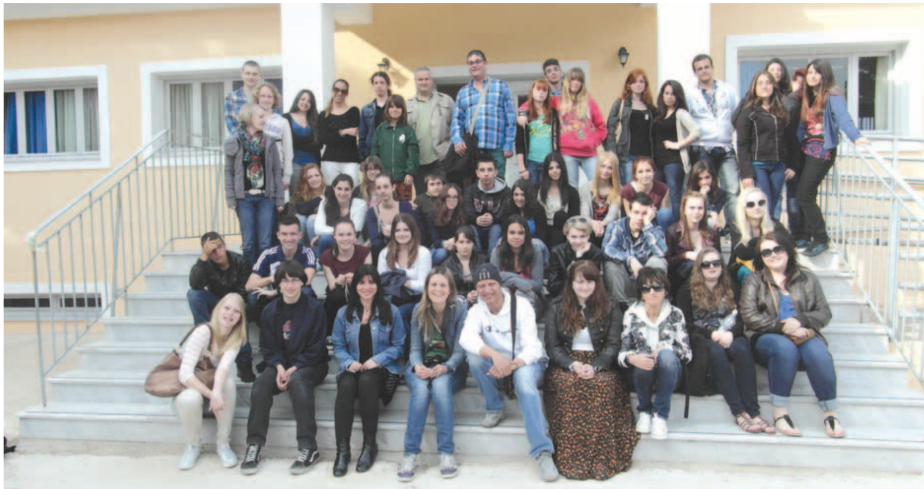
Loo kooli õpetajad ja õpilased Kreekas.

Lähim politseiasutus: Ida-Harju Politseijaoskond, Maardu Karjääri 11, tel. 612 4611