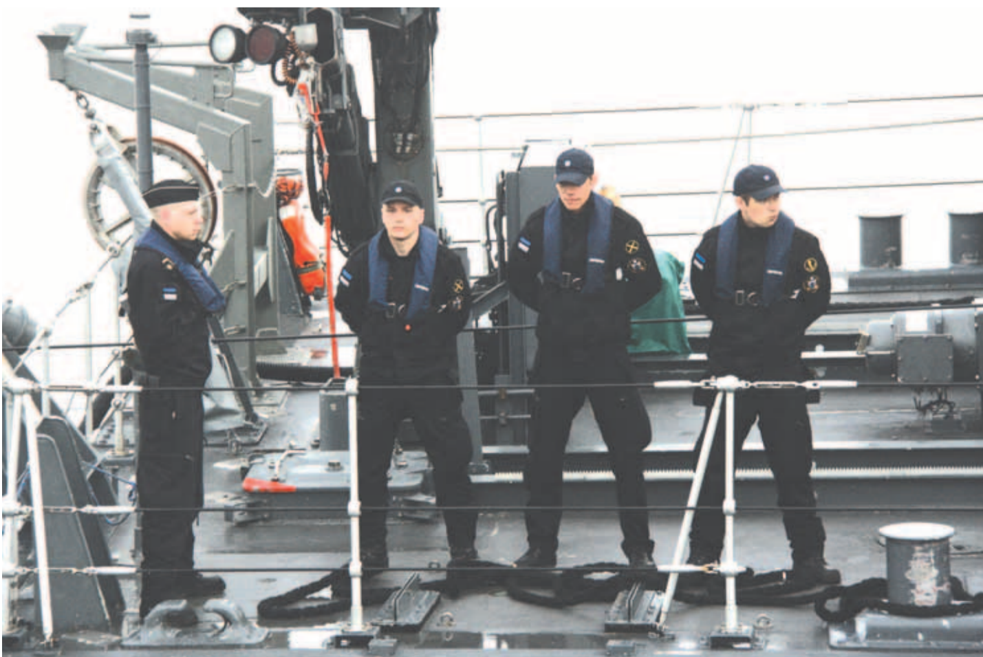
Mereväe laevad transportisid dessantüksuse Tallinna Miinisadamast Ihasalu lahte.

Nafta ja kütteõlide transpordiga kaasnes aga ka veel ebameeldivate gaaside leke ümbruskonda või söe transpordiga must tolm. Uue terminali avamisega midagi sellist ei kaasne. Nii et peaksime Muuga sadamasse soovima rohkem selliseid ettevõtteid.”