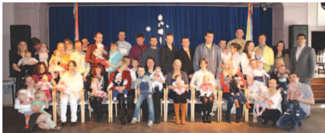
Jõelähtme uued vallakodanikud.