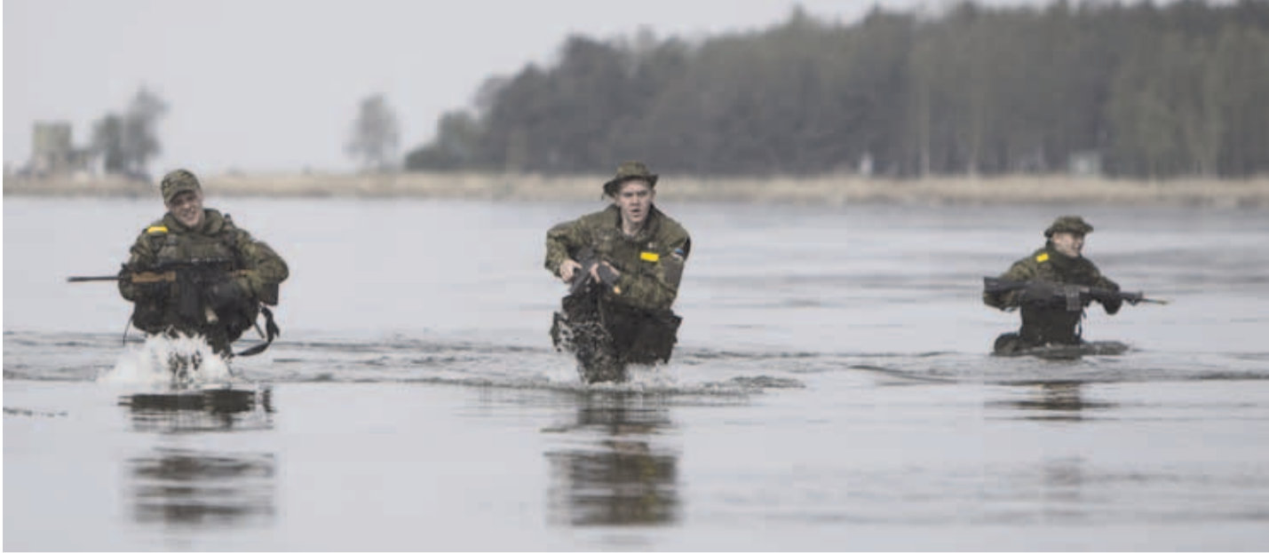
Mereväe Sadamakaitsekompanii võitlejad sooritasid dessandi Ihasalu randa.